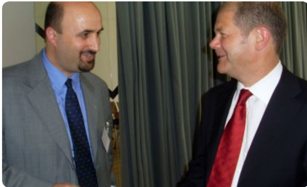
Bürgerdialog mit dem Bundeskanzler (a.D.) Olaf Scholz

Ziel der gemeinnützigen Gesellschaft ist es, u.a. die Ausbil- dungs- und Arbeitsmarktintegration, insbesondere von Einwanderinnen und Einwanderern, zu verbessern und interkulturelle Lösungen für das Einwanderungsland Deutschland zu entwickeln.