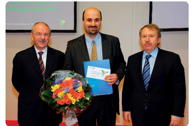
Preisverleihung des „WIB 2008“ durch Minister Helmut Rau und BIBB-Präsident Manfred Kremer